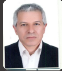
نایب رئیس و دبیر